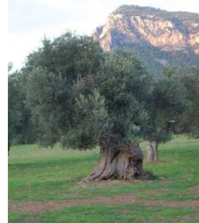
FINCA DEMONICIÓ D'ORIGEN