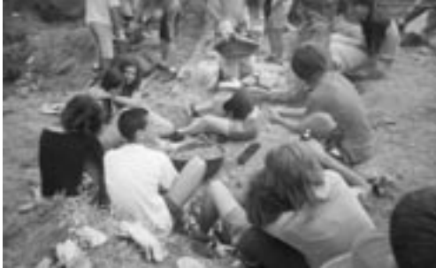
Fundació Josep Carol

FIGURA 25. La Fundació Josep Carol organitza cada estiu camps de treball per a joves, que contribueixen a l'estudi i la recuperació d'entorns naturals i culturals, sovint mitjançant acords amb ajuntaments. En aquest cas, la Fundació i l'Ajuntament de Sant Bartomeu del Grau han coorganitzat un camp de treball per a la recuperació dels entorns de l'església Vella del poble, l'inici d'una excavació que permeti la datació exacta de la construcció de l'església i la recerca de material arqueològic de la zona.