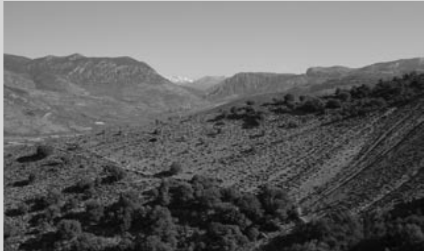
• Josep Àngel Alet/Ajuntament de Tremp

• Un primer conveni amb la Fundació Territori i Paisatge va permetre l'any 2001 la redacció d'un pla de gestió de la Terreta. Posteriorment, s'han signat altres convenis de col·laboració que han permès l'execució de diverses actuacions en l'espai gràcies al suport econòmic i tècnic de la Fundació. Les aportacions d'aquesta entitat de custòdia s'han vist afavorides per l'existència d'un equip tècnic a l'Ajuntament, subvencionat pel Departament de Treball de la Generalitat de Catalunya.