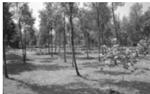
Marc Francó/Fundació Emys

És possible que un ens local hagi obtingut, gràcies a les cessions