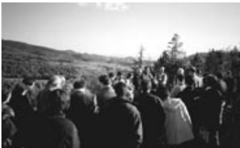
Xarxa de Custòdia del Territori

Els ens locals, en l'establiment de les quotes que cal exigir per a qualsevol taxa, poden tenir en compte tant les característiques del subjecte passiu com les de la mateixa naturalesa de la prestació. En aquest segon cas, la prestació es podria vincular a la custòdia del territori. Els preus públics són aquella contraprestació que un ens local pot exigir per la realització d'activitats o prestació de serveis de la seva competència que no es puguin finançar mitjançant taxes. Si bé els preus públics han de cobrir el cost del servei o l'activitat, la legislació permet que quan hi hagi raons socials, benèfiques, culturals o d'interès públic, es fixin preus públics que no cobreixin íntegrament aquest cost.