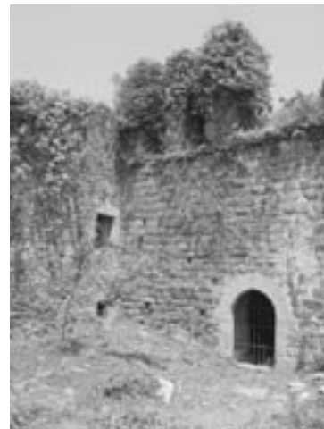
Consortori de les Gavarres

Una entitat local de custòdia és una organització de caràcter públic o privat creada o promoguda per un ens local, de la qual en sol formar part, i que té com a finalitat contribuir a la conservació dels valors naturals i culturals més rellevants del seu àmbit d'actuació (sigui municipal o supramunicipal), mitjançant les tècniques de la custòdia del territori.