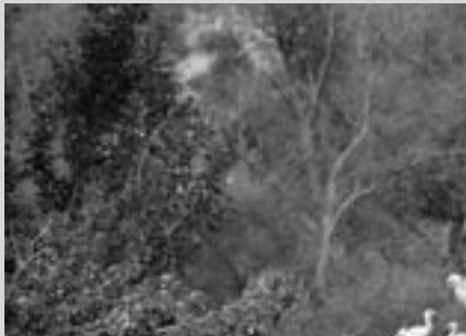
Fundació Territori i Paisatge-Caixa Catalunya

Amb l'objectiu de protegir zones d'interès ecològic o paisatgístic, la Fundació Territori i Paisatge estableix diferents tipus d'acords amb ajuntaments i consorcis, entre els quals destaquen els Convenis d'assessorament