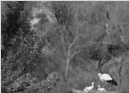
Fundació Territori i Paisatge-Caixa Catalunya